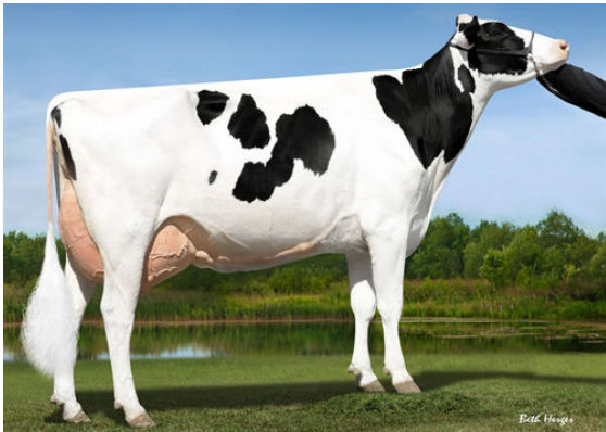
SEAGULL-BAY MOGUL 1725 FOURTH DAM