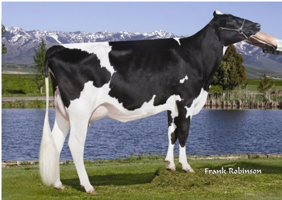
T-C-G OBSERVER MAY FIFTH DAM